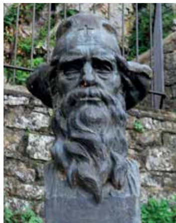
Προτομή του Διονυσίου Σκυλοσόφου στα Ιωάννινα.

Ο νικητής της Ναυμαχίας της Ναυπάκτου βροισκόταν στην πρώτη γραμμή των δυτικών δυνάμεων που εξωθούσαν τους Έλληνες σε εξεγέρσεις.