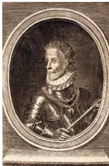
Δον Χουάν της Αυστρίας, χαρακτικό (1727), Βιβλιοθήκη Ανακτόρου της Ειρήνης, Χάγη.

Οι επαφές του με τη Βενετία και τους Ισπανούς, αλλά και με τους Γερμανούς και τον πάπα, σκοπό είχαν να εξασφαλίσουν βοήθεια για τον ξεσηκωμό των Ελλήνων. Η πρώτη απόπειρά του απέτυχε και το Πατριαρχείο τον αποσχημάτισε, με την αιτιολογία «ὅτι ἀλογίστως ἀποστασίαν μελετήσας κατὰ τῆς βασιλείας τοῦ πολυχρονίου Μεχμέτ...». Έτσι, κατέφυγε στην Ιταλία, όπου αγωνίστηκε για τους ίδιους σκοπούς. Τον Φεβρουάριο του 1603 συνα-