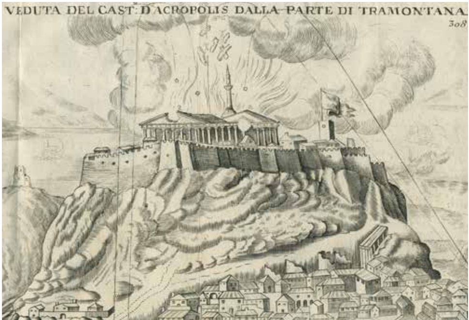
Francesco Fanelli, Ο βομβαρδισμός της Ακρόπολης της Αθήνας από τους Ενετούς τον Σεπτέμβριο του 1687 . Σχέδιο του λοχαγού Giacomo Verneda (1695), Ελληνική Βιβλιοθήκη - Κοινωφελές Ίδρυμα Αλέξανδρος Σ. Ωνάσης (travelogues.gr).

του Francesco Morosini, που κατέκτησε για λίγο την Πελοπόννησο και υπήρξε αιτία για τον βομβαρδισμό του Παρθενώνα το 1687. 8