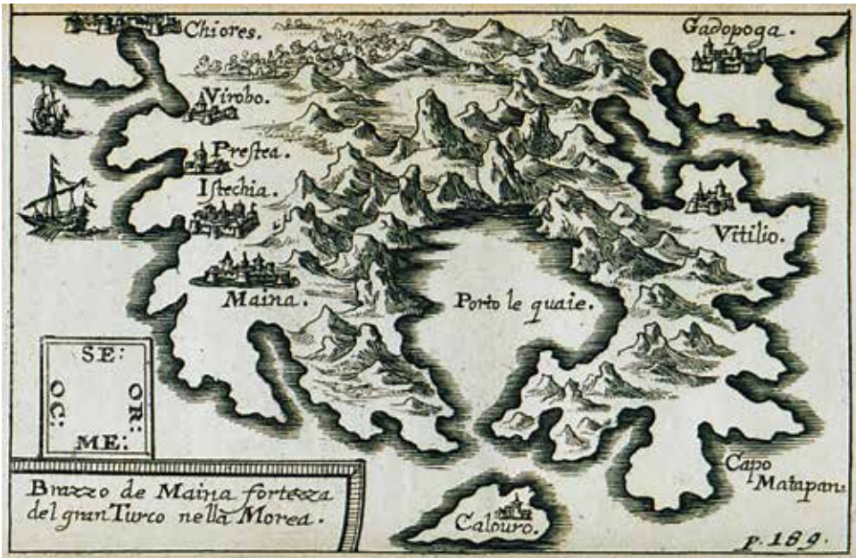
Jacob von Sandrart, Χάρτης της χερσονήσου της Μάνης (1686), Βιβλιοθήκη Ιδρύματος Αικατερίνης Λασκαρίδη (travelogues.gr).

Στην περιοχή ξέσπασαν ταραχές την περίοδο 1479-1481, με πρωτεργάτη τον Κροκόδειλο Κλαδά.