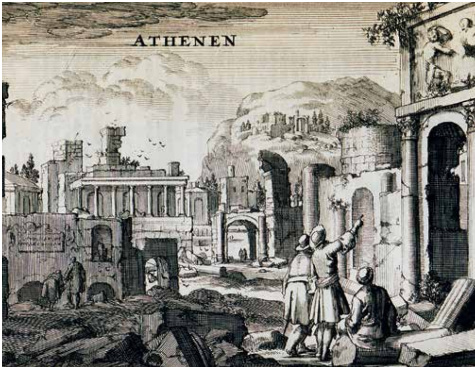
Jacob Spon, O Jacob Spon και ο George Wheeler στα ερείπια της αρχαίας Αθήνας (1689), Γεννάδειος Βιβλιοθήκη - Αμερικανική Σχολή Κλασικών Σπουδών στην Αθήνα (travelogues.gr).

του μανία εις βάρος των αρχαιοτήτων που συγκέντρωνε για λογαριασμό πάλι του δούκα του Μπάκιγχαμ το 1627. Ο αβάς Fourmont ξεπέρασε και τους χειρότερους του είδους σε καταστροφές αρχαίων επιγραφών, ώστε να μη γίνονται αντιληπτές οι δικές του παραχαράξεις. Οι πρώτοι αυτοί αρχαιοκάπηλοι προκάλεσαν ανεπανόρθωτες ζημιές στα αρχαία μνημεία.