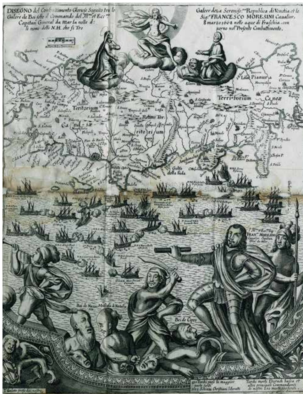
Roger Palmer, Χάρτης της κεντρικής Κρήτης (1669), Ελληνική Βιβλιοθήκη - Κοινοφελές Ίδρυμα Αλέξανδρος Σ. Ωνάσης (travelogues.gr).

Το χαρακτηριστικό απεικονίζει επίσης τη ναυμαχία της 8ης Μαρτίου 1668 ανάμεσα στον οθωμανικό και στον ενετικό στόλο έξω από τον Χάνδακα. Κάτω δεξιά, ο Francesco Morosini πατά πάνω σε αιχμαλώτους Οθωμανούς αξιωματούχους.