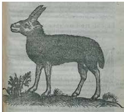
Πρόβατο με ελικοστά κέρατα από την Κρήτη. Χαρακτικό του Γάλλου φυσιοδίφη Pierre Belon (1554), Βιβλιοθήκη Ιδρύματος Αικατερίνης Λασκαριδής (travelogues.gr).

Ο Βρετανός συλλέκτης Keneth Digby διακρίθηκε για την καταστροφική