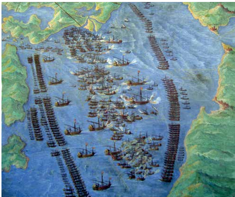
Ignazio Danti, Η Ναυμαχία της Ναυπάκτου (περ. 1580), Πινακοθήκη Χαρτών, Βατικανό.

έχασαν 50. Ο Βρετανός ιστορικός George Finlay έγραψε ότι 25.000 Έλληνες βρέθηκαν στο πλευρό των νικητών. 4